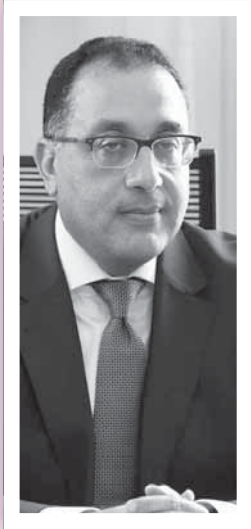
د. مصطفى مدبولي

وأكد التقرير أن مصر تعتبر على المسار الصحيح للتنمية في مجموعة من الأهداف تشمل القضاء على الفقر، والتي تحسنت فيه مؤشرات هدف القضاء على الفقر في عام 2020، على الرغم من وجود بعض التحديات. ■