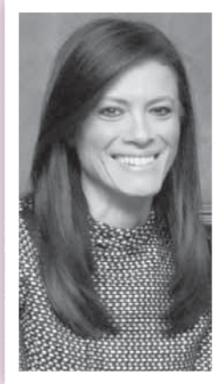
د. رانيا المشاط

بينما سيتم توفير 4 ملايين دولار من خلال الاتفاقيات الثالثة في مجال العلوم والتكنولوجيا، لتوسيع نطاق العلاقة بين المجتمعات العلمية والتكنولوجية بين البلدين، وتعزيز التعاون للأغراض السلمية، وتوفير الاتفاقيات الرابعة 4.4 مليون دولار للتنمية الزراعية والريفية، لزيادة الدخل وفرص العمل للقائمين على الأعمال الزراعية في صعيد مصر، والقاهرة الكبرى ودلتا النيل. ويتم ضخ 10 ملايين دولار ضمن الاتفاقيات الخامسة لتحسين القطاع الصحي من خلال تعزيز برنامج مصر لتنظيم الأسرة والصحة الإنجابية وزيادة فعاليته واستدامته، وتنص الاتفاقيات السادسة على ضخ 26.5 مليون دولار لتحفيز التجارة والاستثمار بهدف تحقيق النمو الاقتصادي وتحسين إنتاجية العمل وزيادة نمو المشروعات الصغيرة والمتوسطة. ■