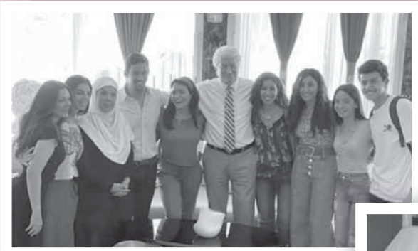
مسلسل «لعبة النسيان».. نهاية مشوار حافل

المرض اللعين ونقلها للمستشفى بيوم واحد لكن القدر حال بين هذه الرغبة واقتصر اللقاء بالاتصال التليفوني لها بينما تعالج في مستشفى الإسماعيلية.