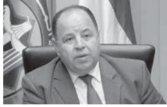
د. محمد معيط

أكد الدكتور محمد معيط وزير المالية، تقديم مواعيد صرف رواتب العاملين بالدولة عن أشهر يوليو وأغسطس وسبتمبر 2020؛ بمناسبة بدء العمل بموازنة العام المالي الجديد 2020/2021، وقرب حلول عيد الأضحى، موضحاً أنه تم تقسيم الوزارات والهيئات والجهات التابعة لها على ثلاثة أيام؛ بحيث تبدأ إتاحة مستحقات العاملين بكل منها في ماكينات الصراف الآلي وفق المواعيد المعلنة بالمنظومة المالية الإلكترونية.