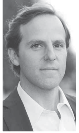
المخرج دان بارتلاندا