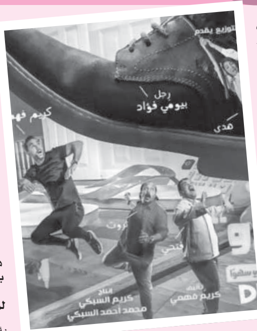
أفيس فيلم «ديدو»