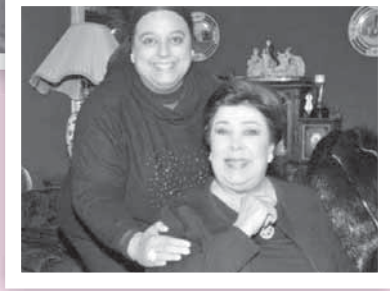
ابنتها «أميرة» أعلى ثروة تركتها

إن ثقة رؤساء مصر للراحلة رجاء الجداوي كضانة قديرة ونموذج نسائي مصري شامخ جسد أحد أدوار المرأة العصرية في المجتمع عبر العهود والعصور، هي أكبر ثروة حققتها عبر مسيرتها الفنية التي استمرت أكثر من 50 عاماً. هذه الثقة رسمت مشاعر الحزن العميق الذي غطى الأوساط الفنية والبيوت المصرية والعربية على رحيلها صباح (الأحد) الماضي.