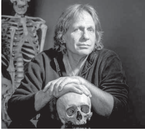
البروفيسر شيلدون سولمون